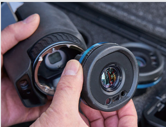
AutoCal™ 光学によりシリーズの全カメラでレンズ(広角から望遠)の共有が可能